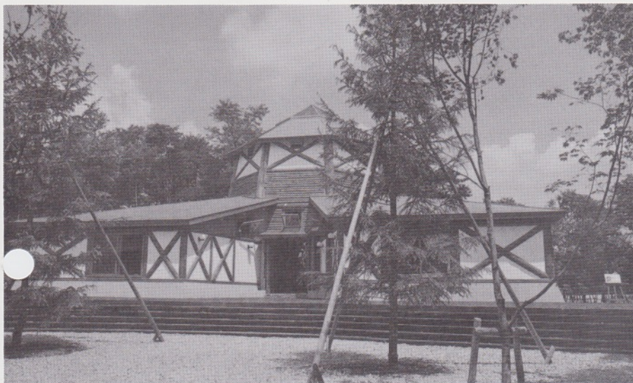
EHON IN THE FOREST Kanazawa Museum of Picture Books

このたびの企画展では、グリム童話を世にひろめた挿絵画家たちを年代を追ってご紹介いたします。ひとつのお話でも、絵によってまったく印象が違うもの。それらのバラエティを、挿絵パネルや絵本原画、オリジナル絵本などで心ゆくまでお楽しみ下さい。