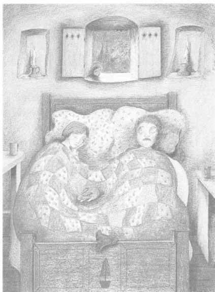
ベルナデッテ(バーナデット)・ワッツ画「4ひきのお友だち」より from The Four Good Friends, illustrated by Bernadette Watts, © 1987 Nord-Süd Verlag AG / North-South Books, 8625 Gossau, Zürich Switzerland