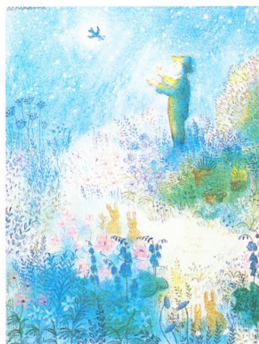
ベルナデット (バーナデット)・ワッツ画「ジョージさんの庭」より ※3