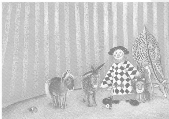
ヨーゼフ・ヴィルコン画「イヤ!と言ったピエロ」より from The Clown Said No, illustrated by Józef Wilkoń, © 1986 Nord-Süd Verlag AG / North-South Books, 8625 Gossau, Zürich Switzerland