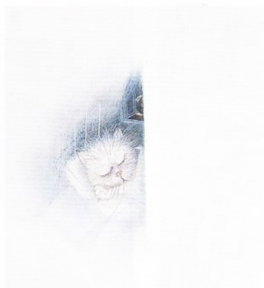
ヨーゼフ・ヴィルコン画「ネコ踏んじやった!」 ※2