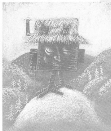
ヨーゼフ・ヴィルコン画「バーバヤガーの家」 illustrated by Józef Wilkoń