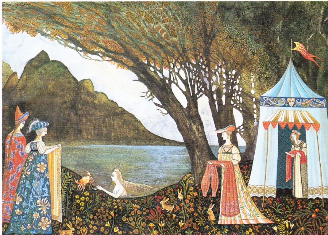
エロール・ル・カイン画「いばらひめ」より ※1