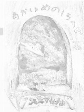
木葉井悦子「あかいめのしろへび」 © 1978 Etsuko Kibai

アフリカに深い愛情を寄せ、サイールやナイジェリアで数年を過ごした木葉井悦子。帰国後に制作された初めての絵本「あかいめのしろへび」をはじめとする彼女の作品には、アフリカ生活から汲み上げられた影響が色濃く見られます。厳しく豊かな自然、大地に根ざした人間の生活、そして命ある者たちとの共存の日々を優しく見つめた木葉井の視線の先をたどります。