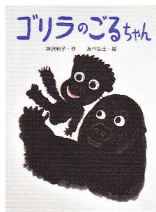
「ゴリラのごるちゃん」 神沢利子文 2010年 ゴブラ社

森の中の美術館が あべ弘士作品の動物園に やさしく強くあたたかい 素敵な仲間たちに会いに行こう!