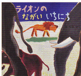
「ライオンのながいいちにち」2004年 成成出版社